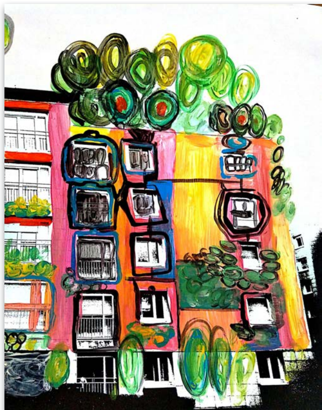
Recherche de peinture par Damien Toillon, inspiré d'Hundertwasser