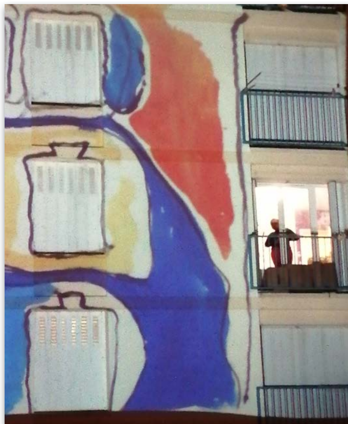
Performance en 2020, un habitant à sa fenêtre