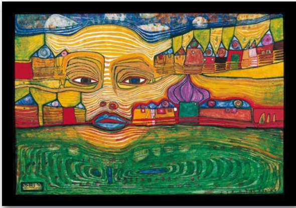
Irinland over the Balkans, 1969

Hundertwasser (1928-2000) ici en 1997, époque de ses derniers séjours en Normandie