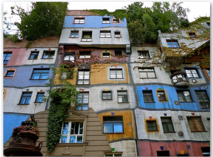
Exemple des réalisations architecturales d'Hundertwasser, Hotel spa Bad Blumau à gauche, KunstHausWien, à droite ©Die Hundertwasser gemeinnützige Privatstiftung Wien

Ci-dessous, découverte de la maison à l'abandon dans le Perche (collection Gabriel Soulard).